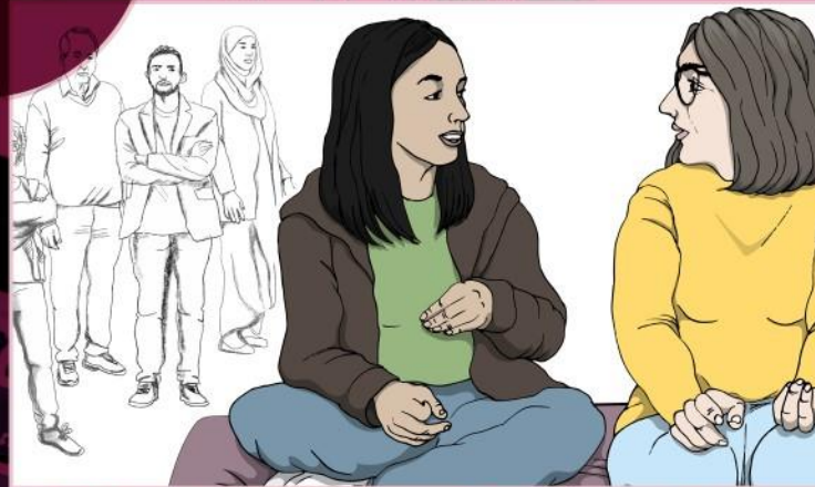
Hedersrelaterat våld och förtryck