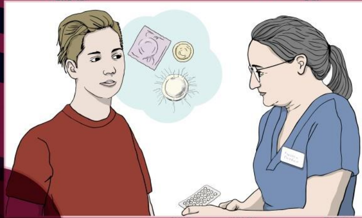
Digitala/fysiska temaseminarium SRHR