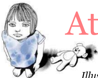
Illustration: Moa Dunfalk

Att bli lyssnad på och trodd betyder allt