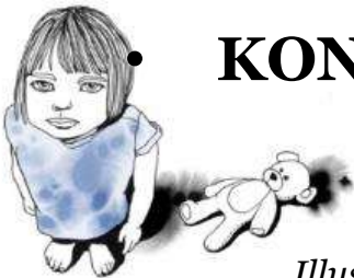
Illustration: Moa Dunfalk