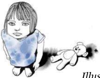
Illustration: Moa Dunfalk

”Man har vänner , det är det som är viktigast med skolan.” – Flicka, 10 år