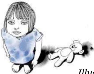
Illustration: Moa Dunfalk

Motsvarande siffra för förskola är nära sju av tio .