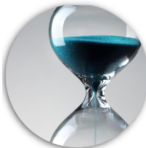
TID FÖR ANALYS